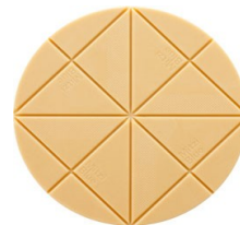
Mitzi Blue „Liebeshimmel“ von Zotter